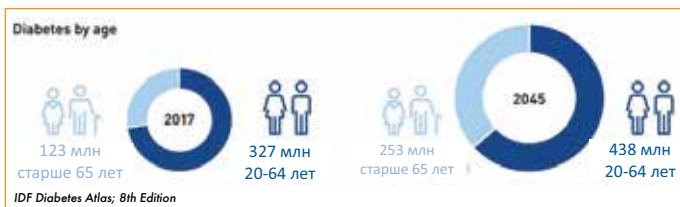
Рис. 2. Ожидаемый рост заболеваемости сахарным диабетом