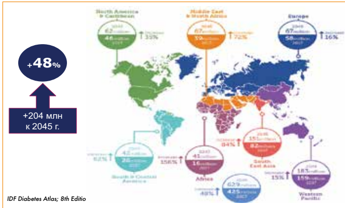
Рис. 1. Сахарный диабет – нарастающая эпидемия глобального масштаба