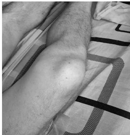
Рис. 2. Miliaria cristallina на стегнах і гомілкках