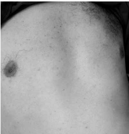
Рис. 1. Міліарна висипка ( Miliaria cristallina ) на грудях і животі

Загальний аналіз крові засвідчував розвиток лейкоцитозу із зсувом лейкоформули вліво, тромбоцитопенії, підвищення ШОЕ (табл. 1).